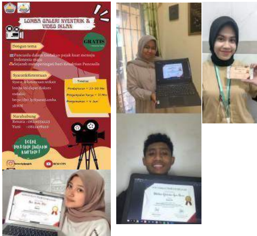
Gambar 4.12 Kepo Alumni STPI