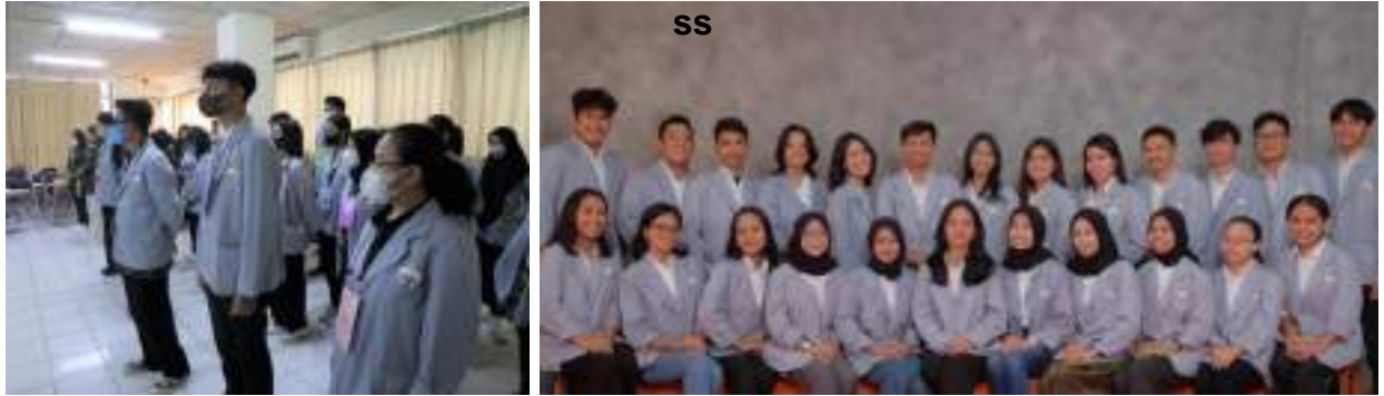
Gambar 4.2 Latihan Kepemimpinan Manajemen Mahasiswa (LKMM) & Latihan Kepemimpinan Tingkat Dasar (LKTD) Tahun 2022