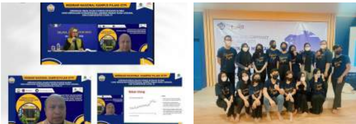
Gambar 2.2.2 Pengabdian Kepada Masyarakat

Kegiatan pengabdian pada masyarakat yang dikelola LPPM STPI pada Tahun 2022 adalah dengan Menyelenggarakan Webinar Nasional Tax Center dan Penugasan Mahasiswa sebagai Relawan Pajak di lingkungan Kanwil DJP Jakarta Timur.