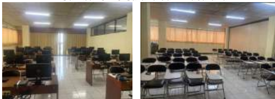
Gambar 3.2.5 Sarana dan Prasarana

Untuk menjaga keamanan sarana dan prasarana gedung STPI dilakukan pemasangan pengaman kunci gembok pada pintu diseluruh ruangan dan di pagar gedung STPI serta ditugaskan juga security yang berjaga selama 24 Jam. Rencana pengembangan lima tahun mendatang ditujukan untuk peningkatan sarana penunjang di ruang kelas dan laboratorium serta penambahan prasarana berupa penambahan gedung ruang kelas dan perpustakaan yang rencananya akan dibangun di belakang gedung yang saat ini sudah ada. Pengembangan juga ditekankan pada pengadaan dan pembaharuan alat-alat laboratorium dan peralatan multimedia di tiap ruang kelas. Tingkat penggunaan sarana yang cukup tinggi, mengharuskan adanya sebuah UPT (Unit Pelayanan Teknis) untuk melakukan proses perawatan.