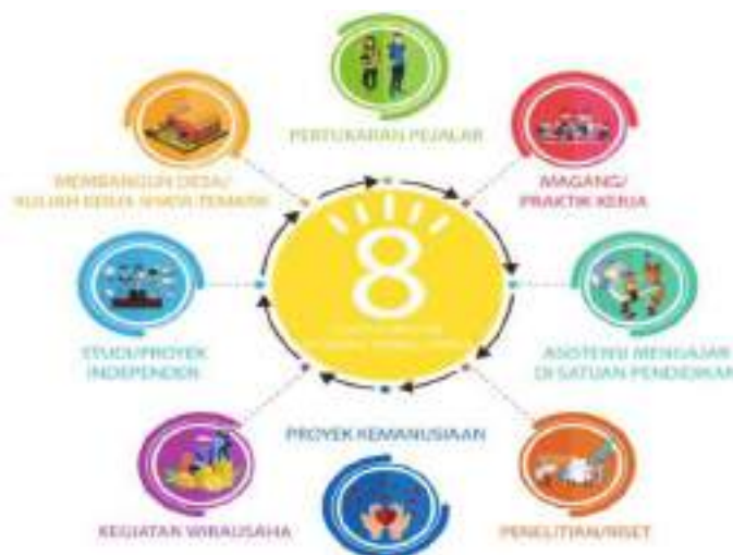
Gambar 2.1 Program MBKM

Merdeka Belajar Kampus Merdeka (MBKM) merupakan program yang dicanangkan oleh Menteri Pendidikan dan Kebudayaan dengan tujuan mendorong mahasiswa untuk menguasai berbagai keilmuan untuk bekal memasuki dunia kerja. Melalui kebijakan ini, Kampus Merdeka memberikan kesempatan kepada mahasiswa secara bebas memilih mata kuliah yang akan mereka ambil di luar program studi pada perguruan tinggi yang sama; mengambil mata kuliah pada program studi yang sama di perguruan tinggi yang berbeda; mengambil mata kuliah pada program studi yang berbeda di perguruan tinggi yang berbeda; dan/atau pembelajaran di luar perguruan tinggi.